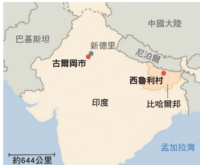
資料來源/綜合外電 製表/陳韻涵 好讀周報