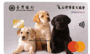
▲ 一卡通導盲犬認同卡