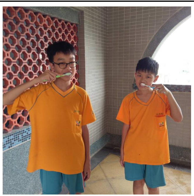
每一顆牙齒都不放過，都要刷乾淨