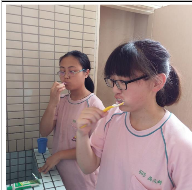
吃飽飯後，大家一起來刷牙