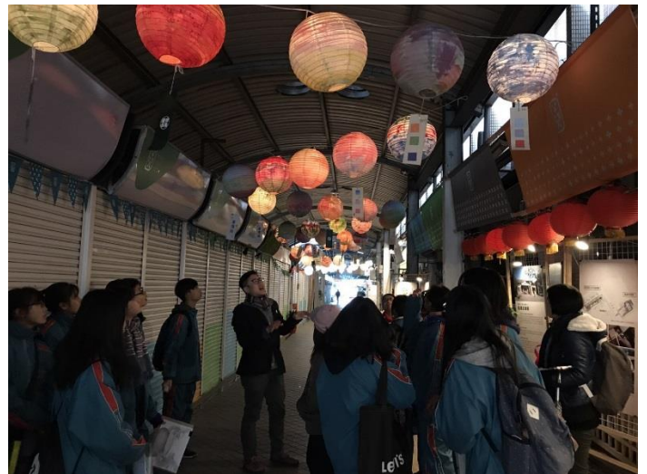
與校外專業人員協同教學，進行在地人文環境實察。