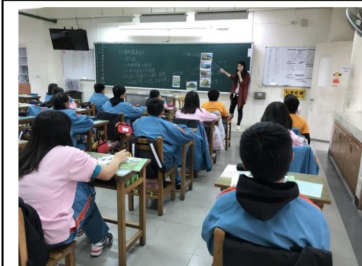
同學們認真聆聽雅瑄老師的課程。