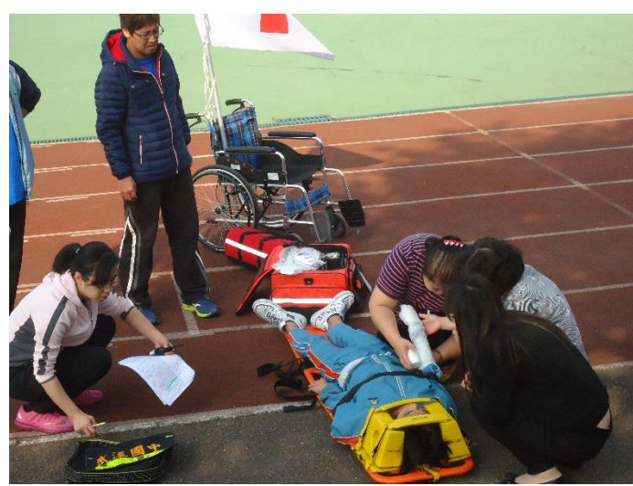
模擬學生受傷，進行緊急包紮治療。