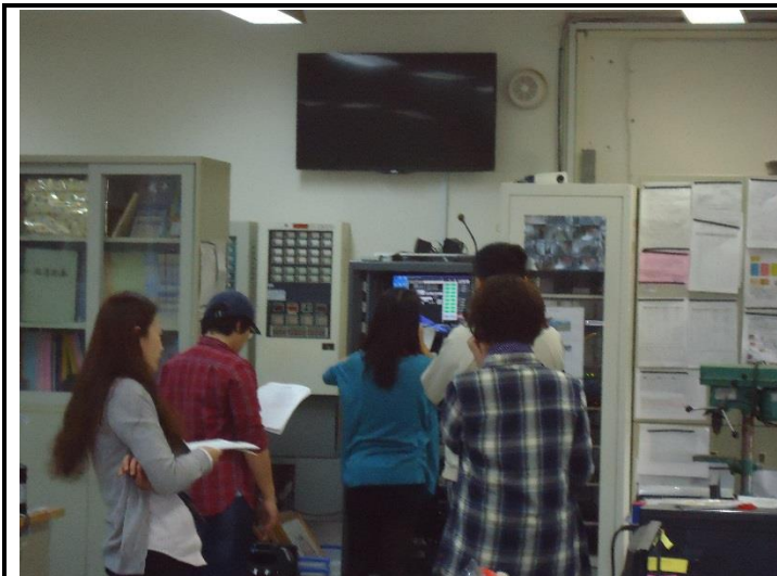
防災演練開始，使用有聲廣播模擬地震發生。