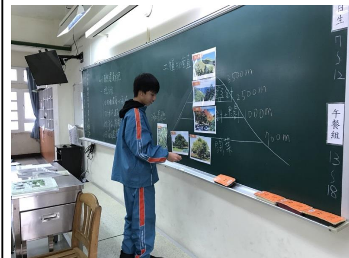
實際動動手印象更深刻。