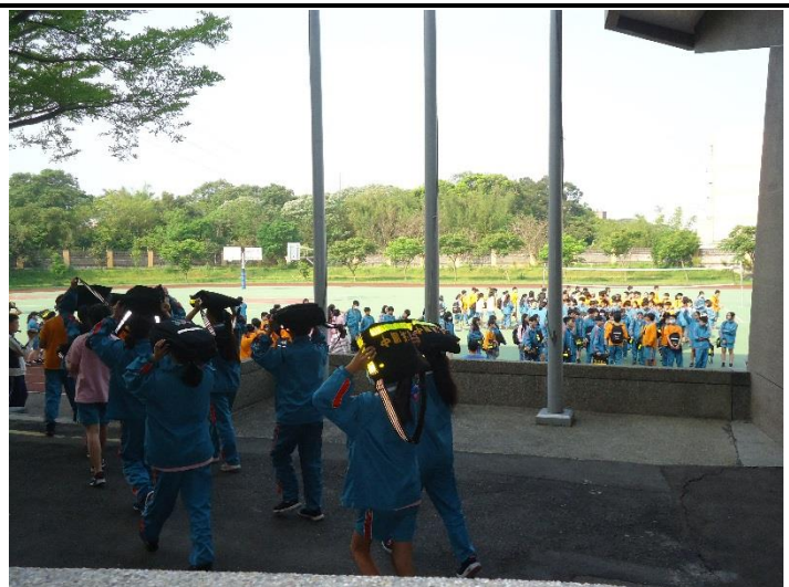
學生採取避難動作至操場集合。