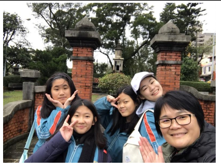
進行聖蹟亭深入訪察。