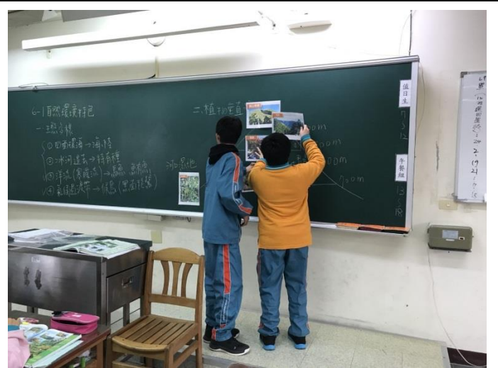
同學們進行植物垂直分布配對活動。