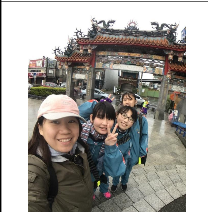
帶領學生進行南天宮探訪。