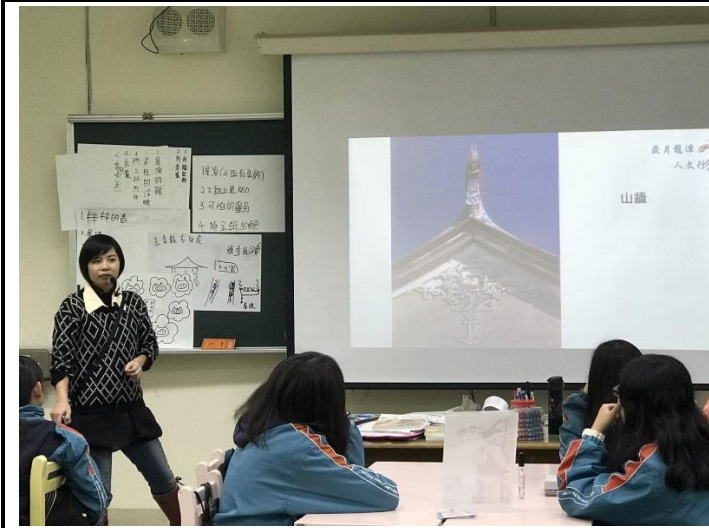
對在地人文環境進行初步的認識。