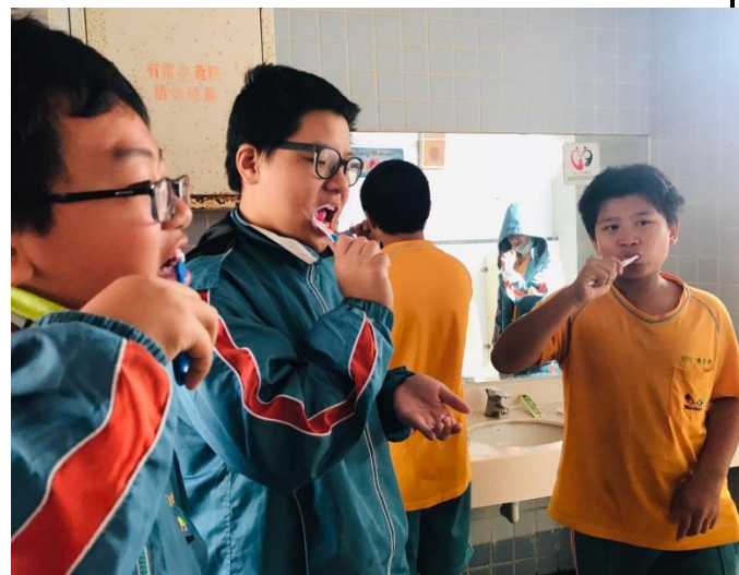
成果照片：餐後潔牙活動