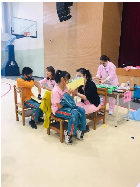
成果照片：流感疫苗注射