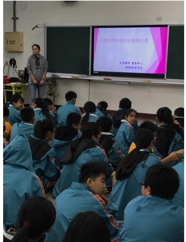
成果照片：HPV 宣導活動