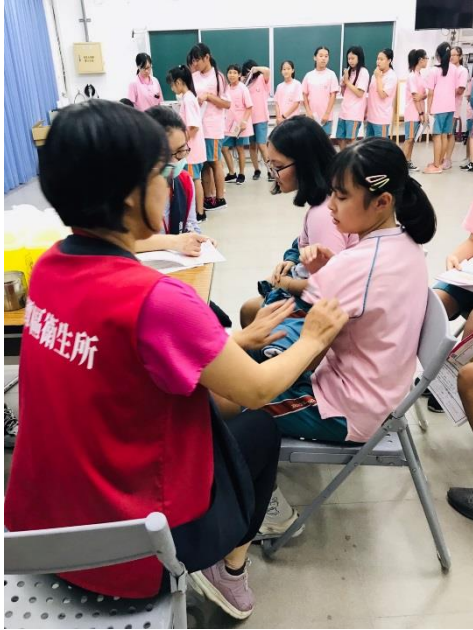
成果照片：HPV 疫苗注射