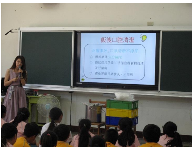
成果照片：口腔潔牙保健宣導