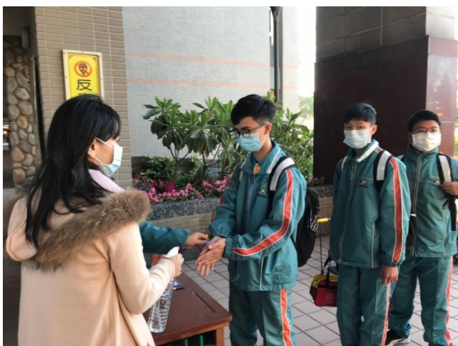
成果照片：新冠肺炎防疫