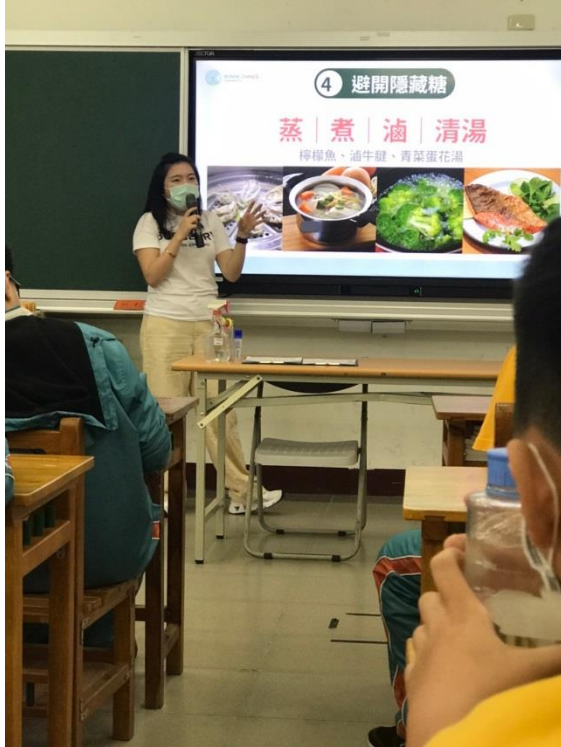
成果照片：減醣營養講座