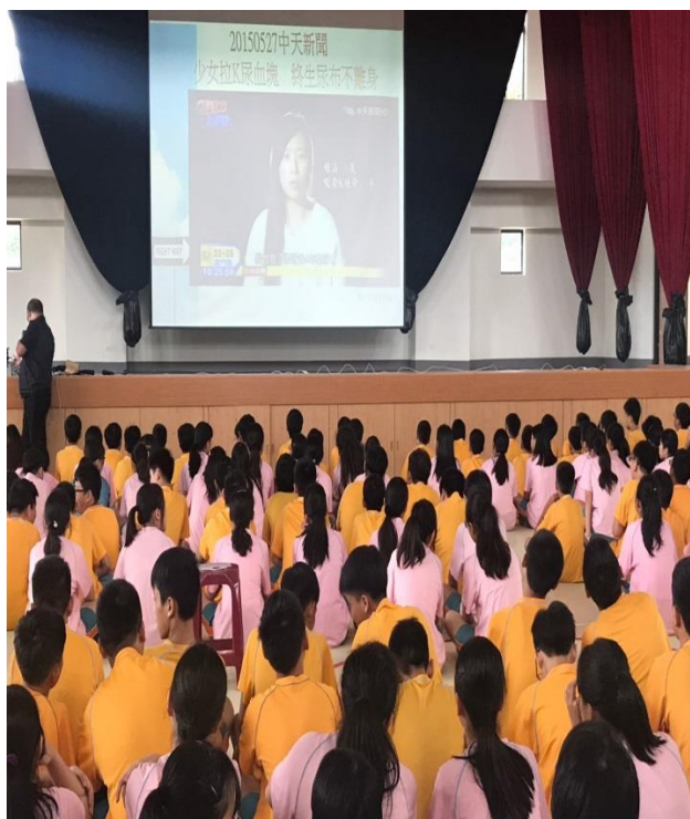
成果照片：反菸拒檳宣傳