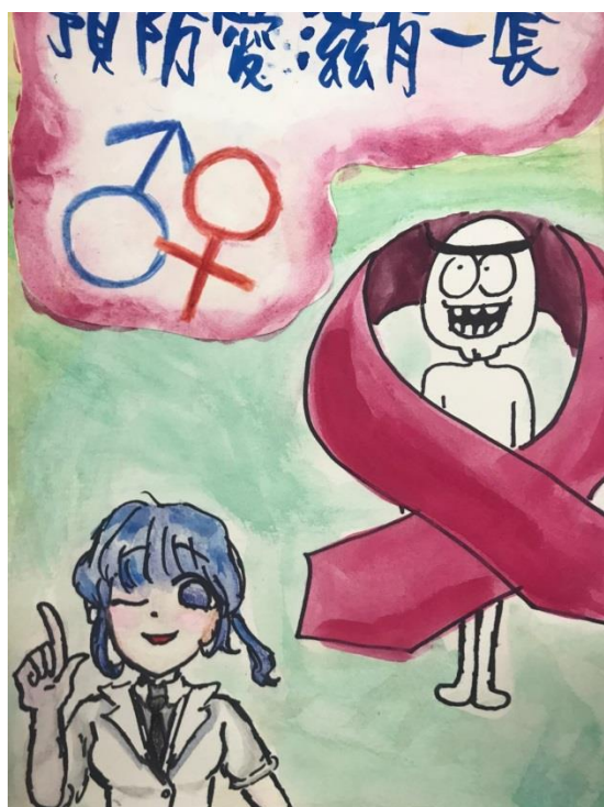
成果照片：性教育小書