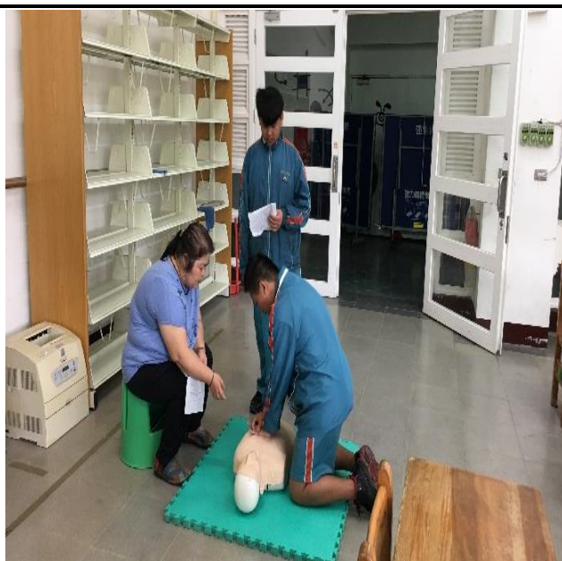
成果照片：CPR 急救教育考照