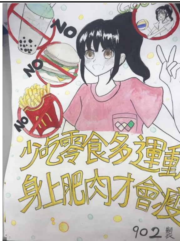
成果照片：健康體位海報比賽