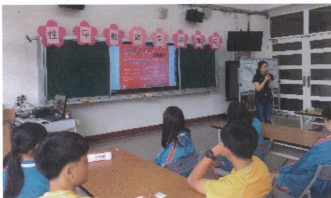
成果照片：愛滋防治宣導