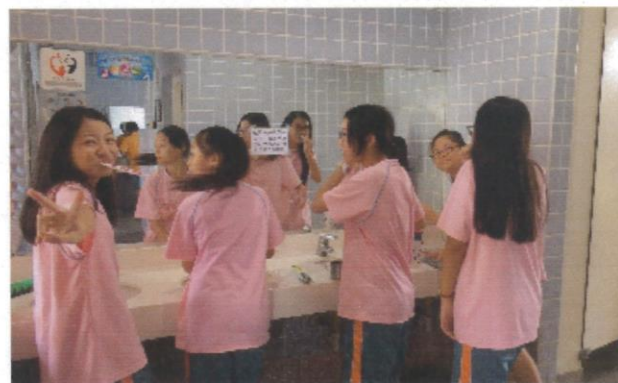
成果照片：餐後潔牙活動