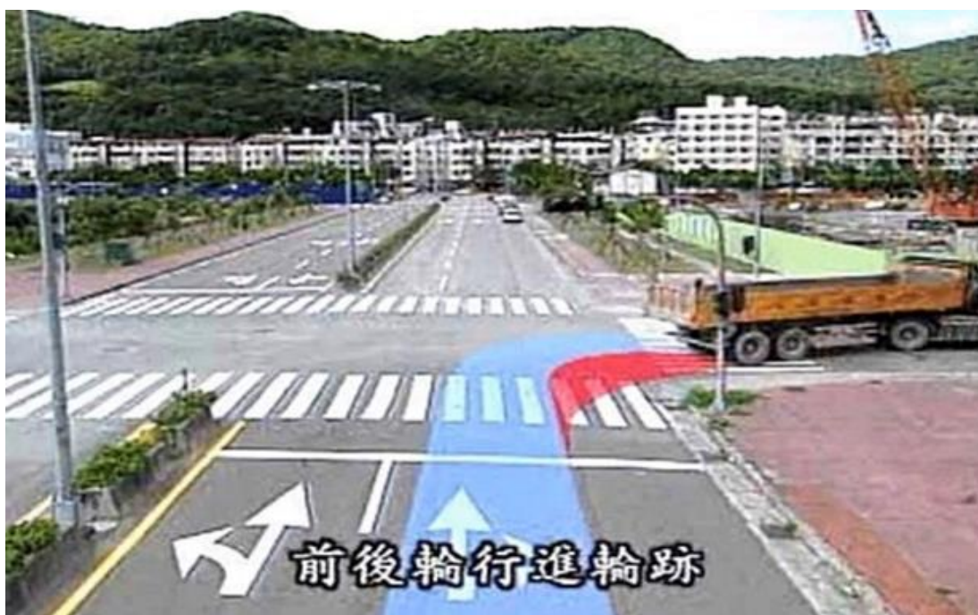
交通安全教育融入健體領域教學