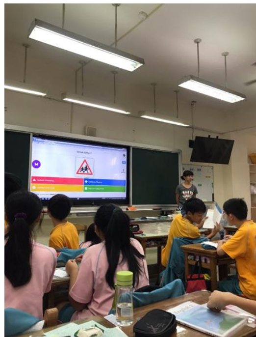
交通安全教育融入英語科教學