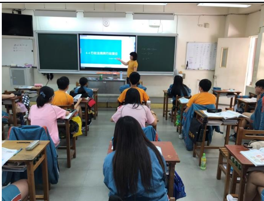
交通安全教育融入社會領域教學

2-1 規劃符合交通安全核心能力的教學課程與設計相關教案， 並運用相關資源進行教學。