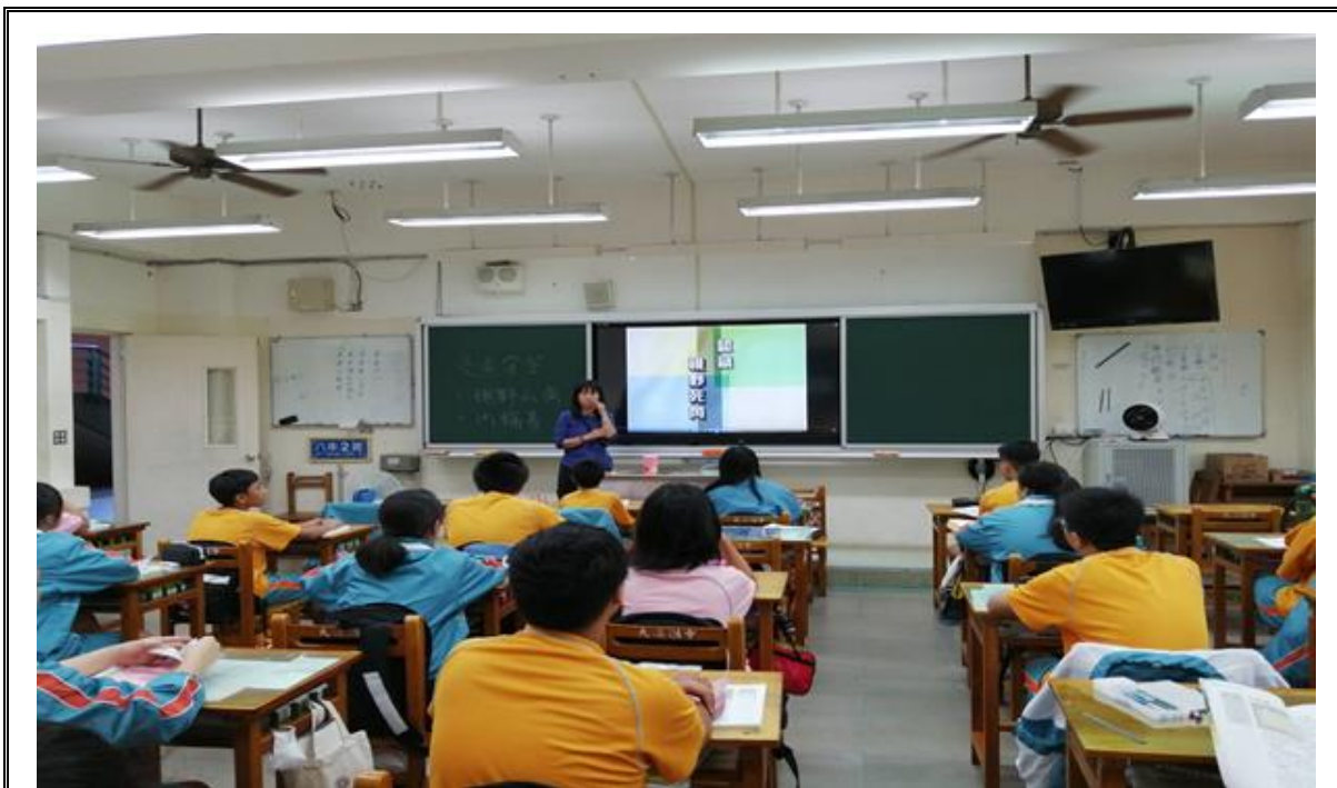
交通安全教育融入健體領域教學

2-1 規劃符合交通安全核心能力的教學課程與設計相關教案， 並運用相關資源進行教學。