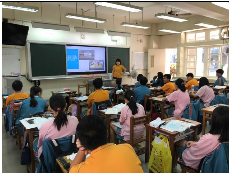
交通安全教育融入社會領域教學