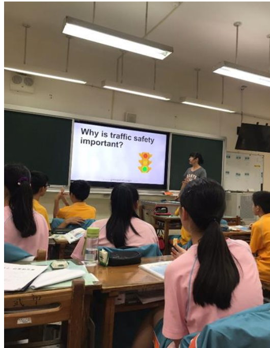
交通安全教育融入英語科教學

2-1 規劃符合交通安全核心能力的教學課程與設計相關教案， 並運用相關資源進行教學。