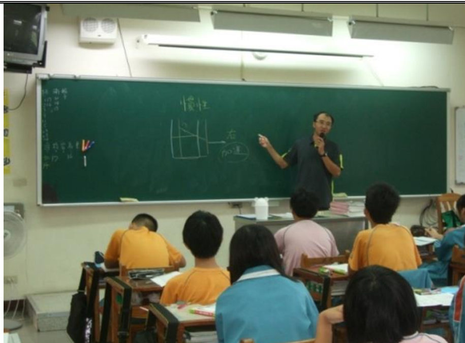
交通安全教育融入理化科教學

2-1 規劃符合交通安全核心能力的教學課程與設計相關教案， 並運用相關資源進行教學。