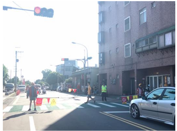
說明：交通服務隊執行狀況 1