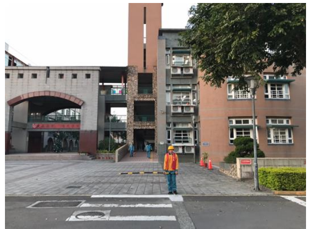
說明：交通服務隊執行狀況 3