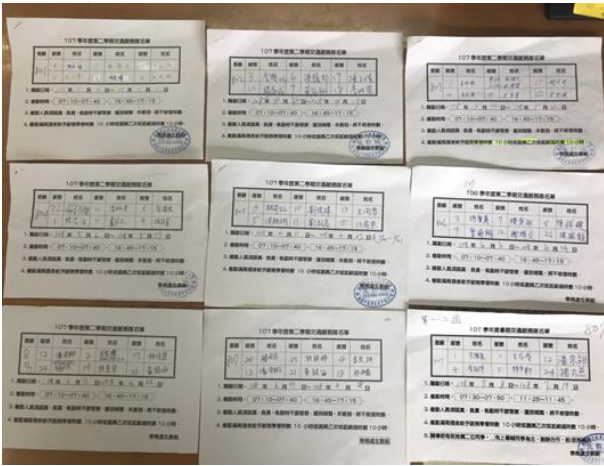
說明：導師推薦交通服務名單