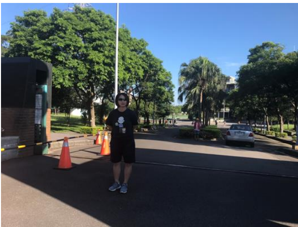
說明：交通服務隊執行狀況 2