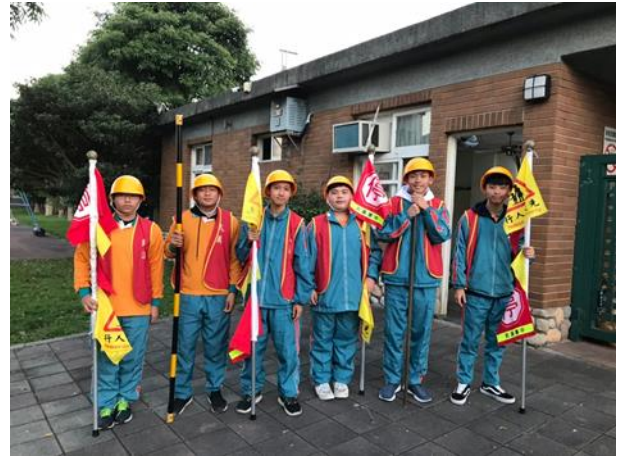
說明：交通服務隊培訓合影