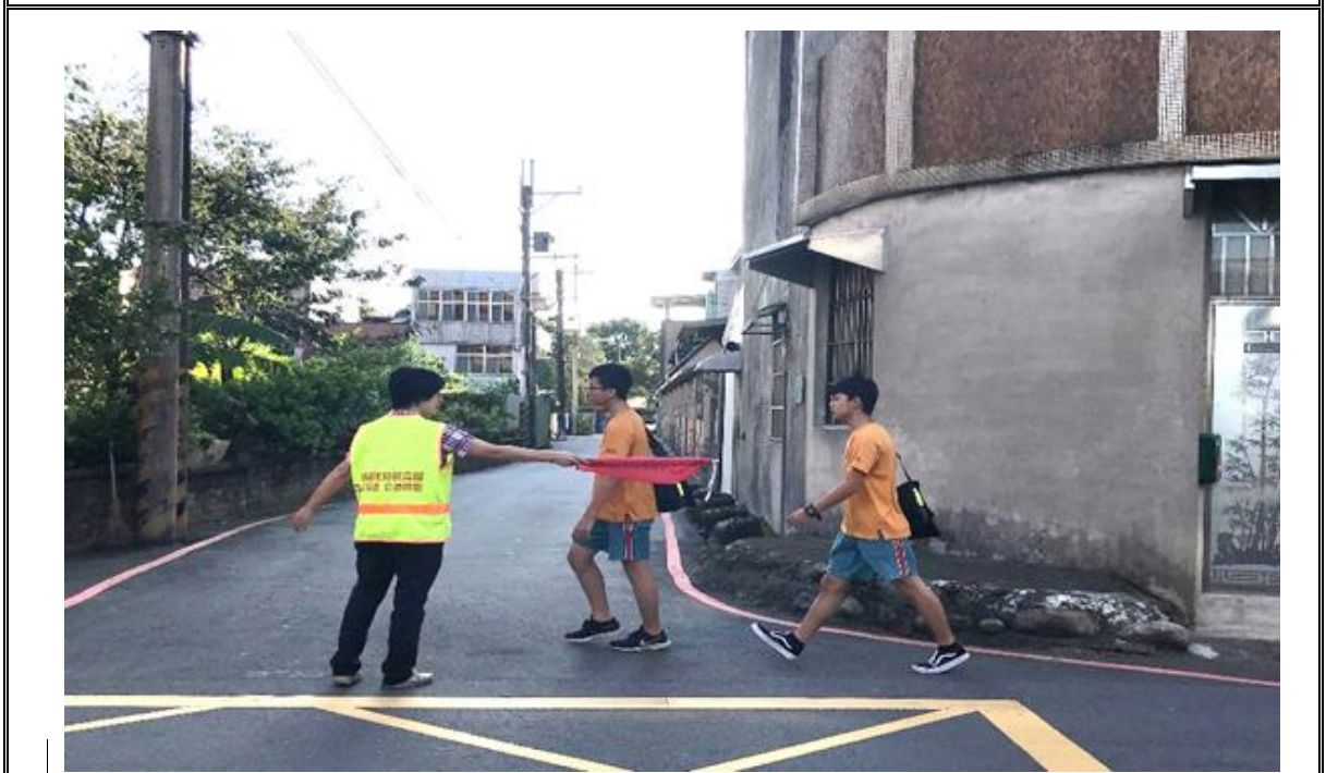
教師分組：學務處組長、行政組長、專任三組協助三個路口上放學導護