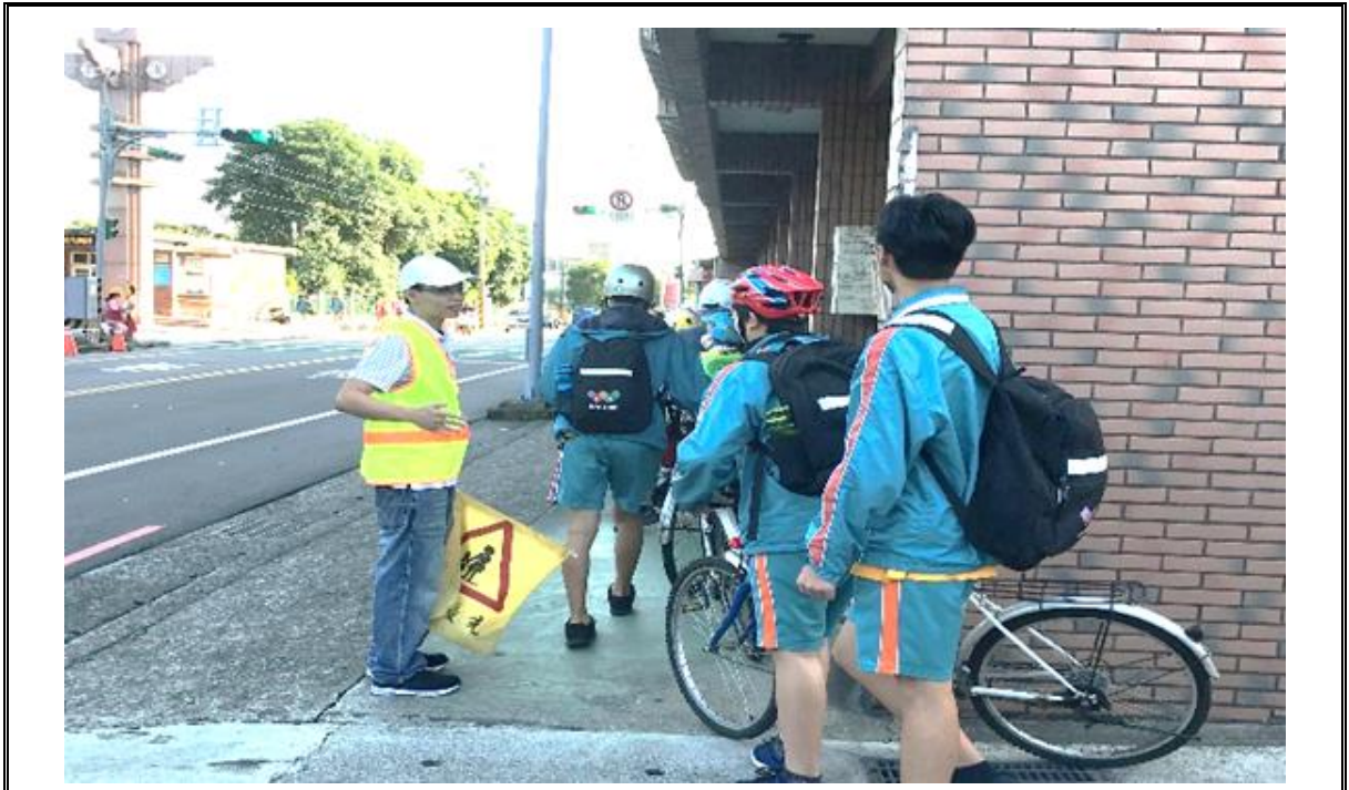
教師分組：學務處組長、行政組長、專任三組協助三個路口上放學導護