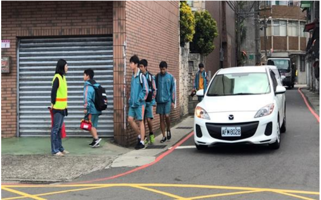
教師分組：學務處組長、行政組長、專任三組協助三個路口上放學導護