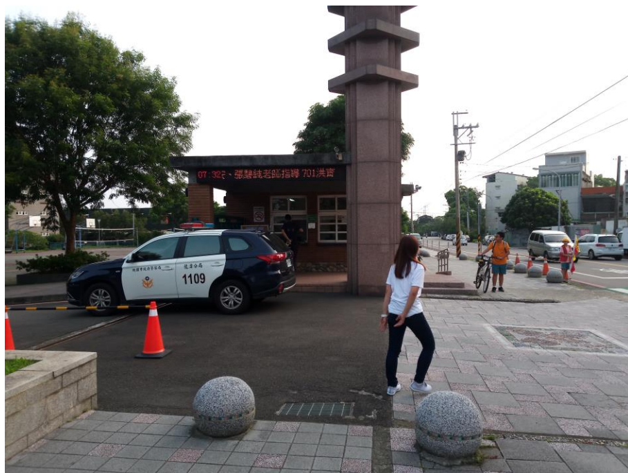
校長和中興所警員早上上學於校門口進行交通導護