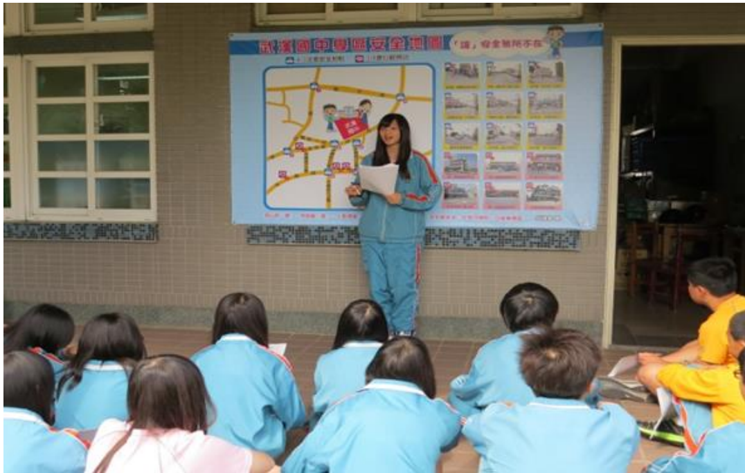
自治市幹部對新生進行校園安心商店和安全地圖進行說明介紹