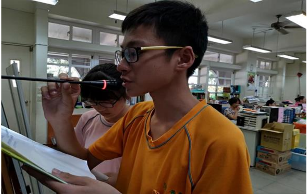
中午用餐時間自治市幹部對全校師生進行交通安全相關注意事項的宣導