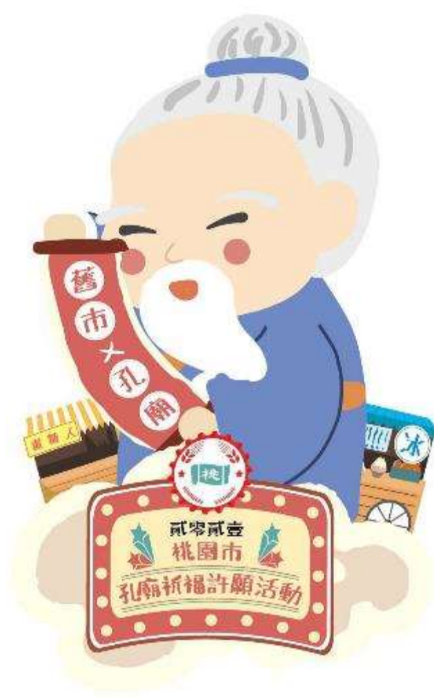
本次活動主視覺及邀請卡