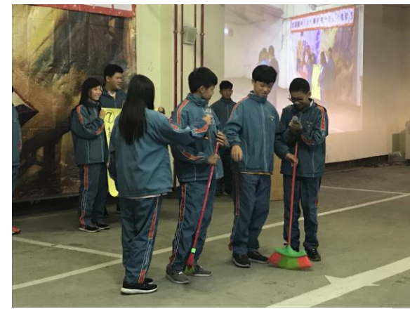
106學年度自治市長政見發表會