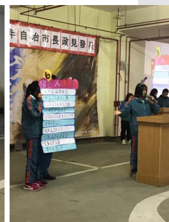
107學年度自治市長政見發表會