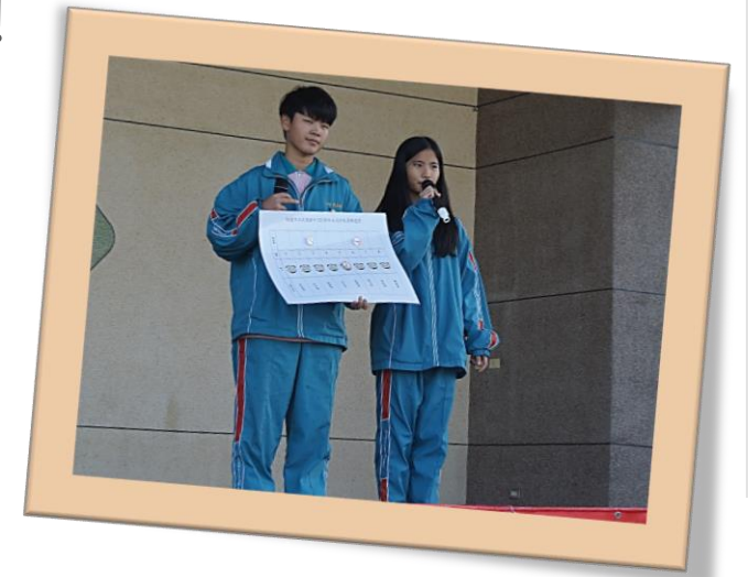
105學年度自治市長政見發表會

藉由自治市長政見發表會，讓全校同學了解每位自治市長候選人的政見與理念，也透過現任自治市長與副市長針對民主素養與選舉投票的方式與同學們說明，讓他們更了解民主的價值並將自己手中神聖的一票發揮最大的效益，一起讓武漢國中更好！