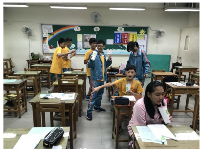
[英] 上課情形：課程總複習並獎勵孩子