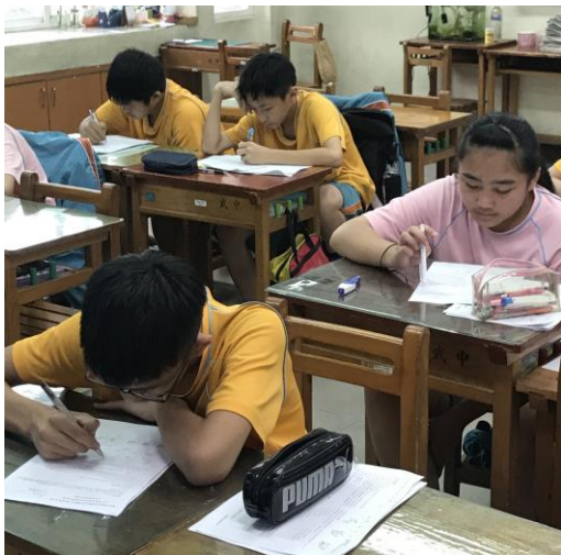
[英] 上課情形：紙本練習