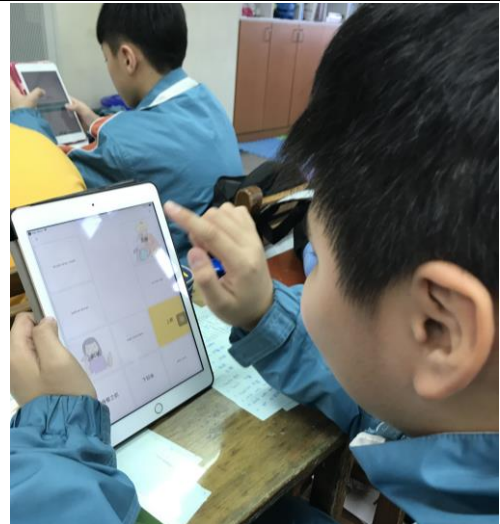
[英] 上課情形：使用 app 自我測試