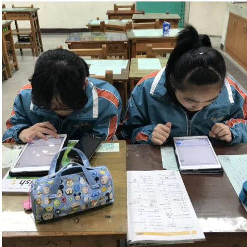
[英] 上課情形：使用 ipad 練習單字