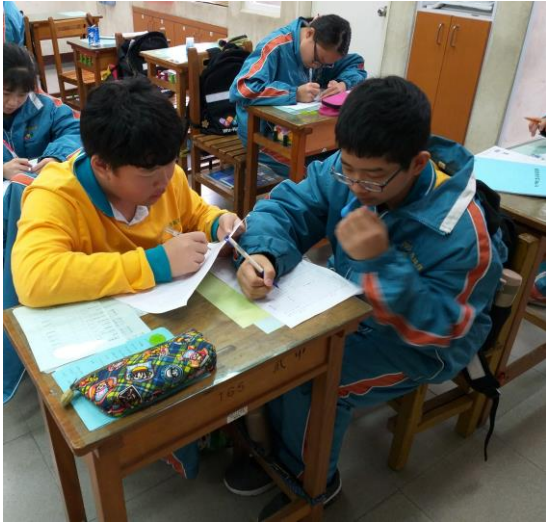
[數] 上課情形：直角坐標遊戲，學生互相練習