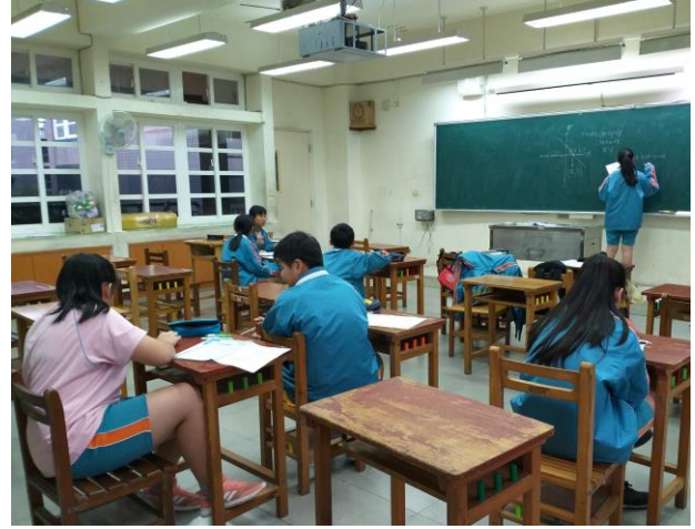
[數] 上課情形：二元一次方程式圖形學生上台講解