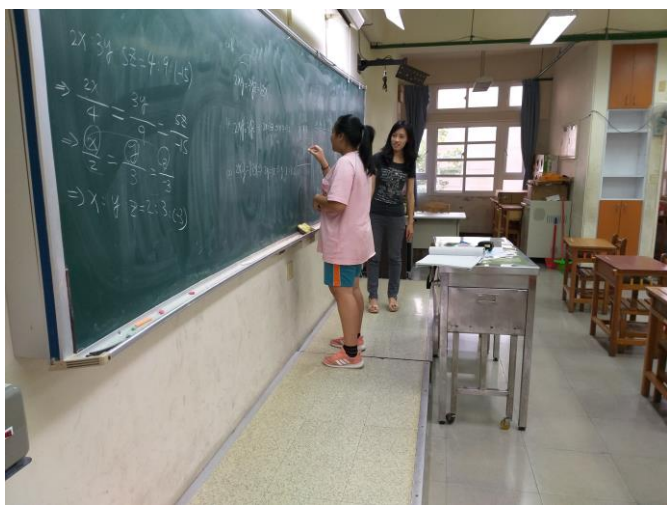
[數] 上課情形：比例應用問題學生練習