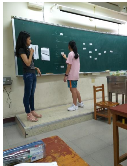
[數] 上課情形：不等式學生練習配對