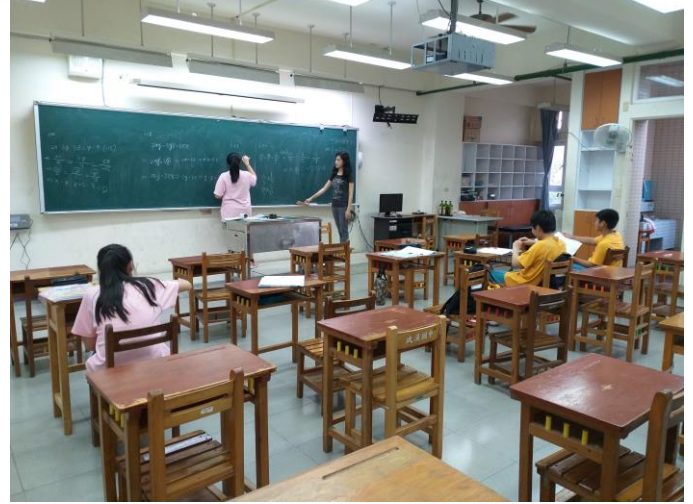
[數] 上課情形：比例式學生練習