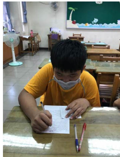
[英] 上課情形：自己完成學習單