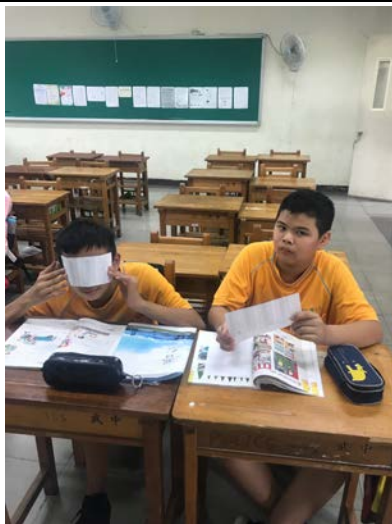
[英] 上課情形：pair work 練習疑問詞