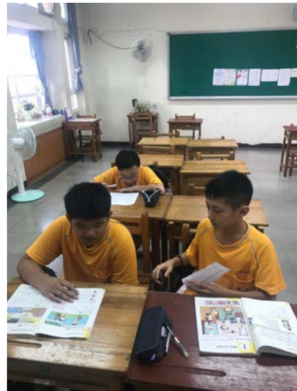
[英] 上課情形：pair work 互考人稱代名詞