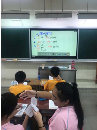
[英] 上課情形：人稱代名詞教學