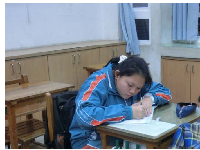
[數] 上課情形：自我練習