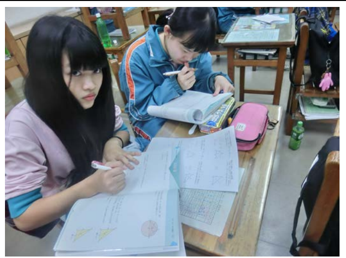
[數] 上課情形：小組針對題型互相討論