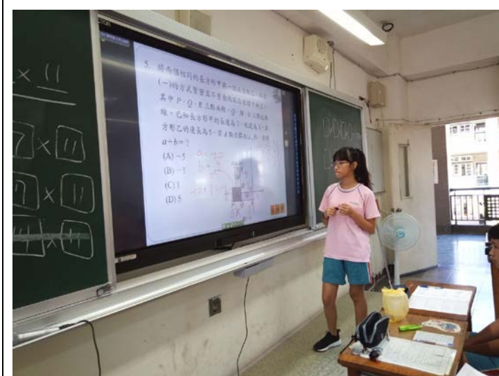
[數] 上課情形：較優的同學上台發表