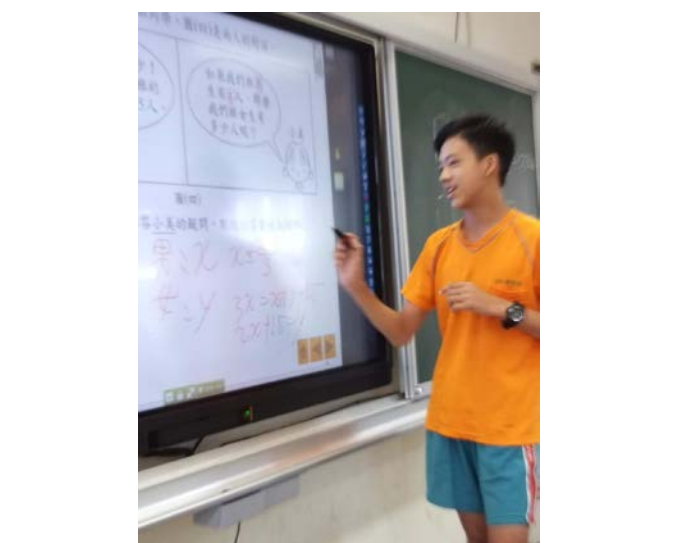
[數] 上課情形：較優的同學上台發表