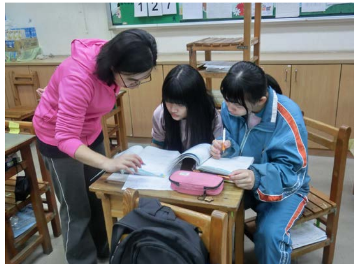
[數] 上課情形：老師做個別指導